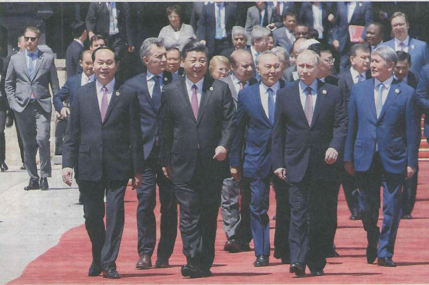
5月15日，“一带一路”国际合作高峰论坛在北京雁栖湖国际会议中心举行圆桌峰会，国家主席习近平主持会议并致辞。图为习近平同与会领导人和国际组织负责人步出雁栖湖国际会议中心。

15日傍晚，圆桌峰会联合公报出炉了。这份公报的行文犹如一首令人震撼的长诗。它分为18个要点，几乎每一要点的主题都是“我们”。“我们这来到”“我们祝愿”