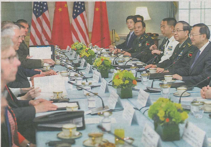
当地时间21日上午，首轮中美外交安全对话在美国华盛顿举行。

6月21日，中美首轮外交安全对话在华盛顿举行，中国国务委员杨洁篪将同美国国务卿蒂勒森、国